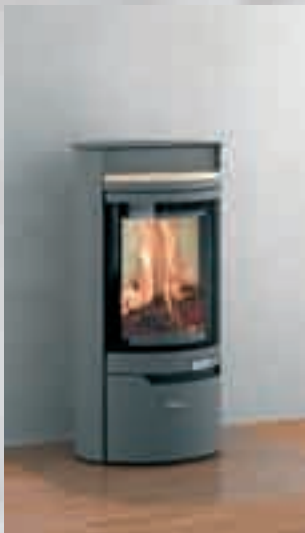
Alid mit Keramikeinleger ahorn