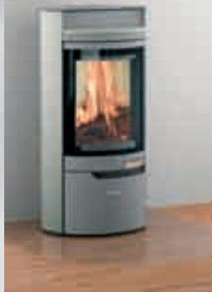
Alid mit Natursteinverkleidung